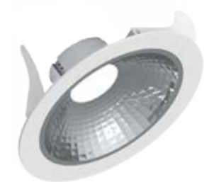
Luci Series Silver Shop 185