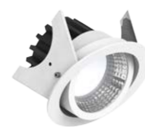
Luci Series Silver 90 directional