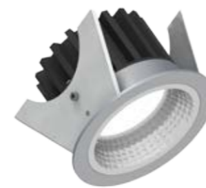
Luci Series Silver 75 fijo