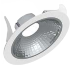
Luci Series Silver Shop 185