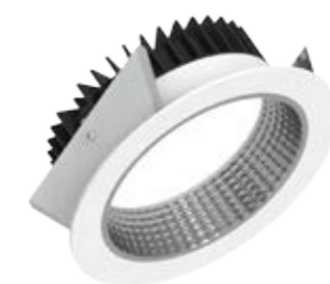
Luci Series Silver 185 fijo